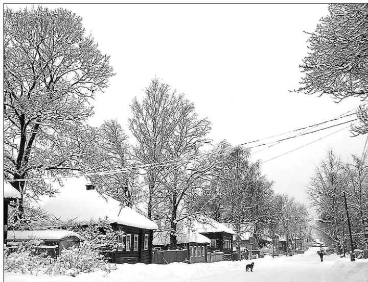
Пудожская улочка.

В целях снижения негативных последствий экономического кризиса в Пудожском районе создана и продолжает деятельность специальная комиссия по контролю за социально-экономической ситуацией и координации действий по стабилизации ситуации в сфере занятости.