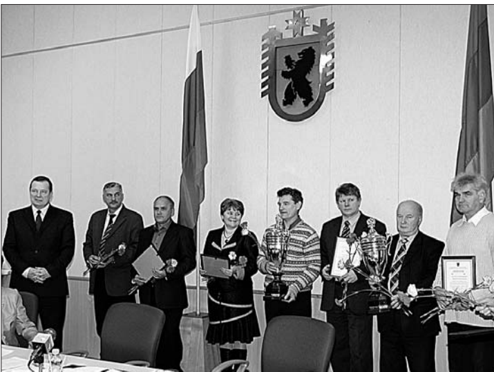
Подведены итоги конкурсного отбора населенных пунктов Республики Карелия на лучшее благоустройство и озеленение территорий за 2009 год.

Конкурсный отбор проводился по четырем группам населенных пунктов. При подведении итогов организаторы конкурса учли состояние улично-дорожной сети, в том числе освещение, санитарное состояние населенных пунктов, внешний вид зданий, обеспеченность детскими игровыми и спортивными площадками, зелеными насаждениями, всего 14 показателей.